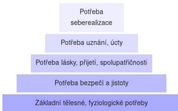
Maslowova pyramida potřeb